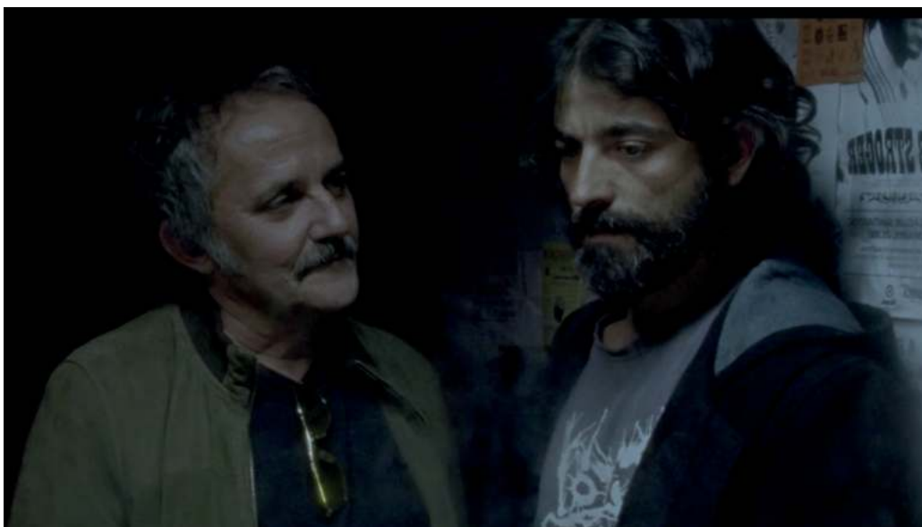
A Estación Violenta , vémonos no baño