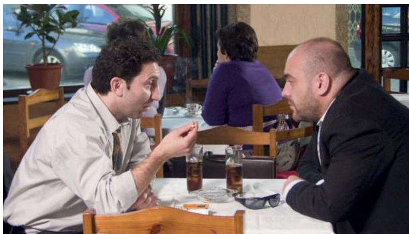
18 comidas , os praceres do reenganche