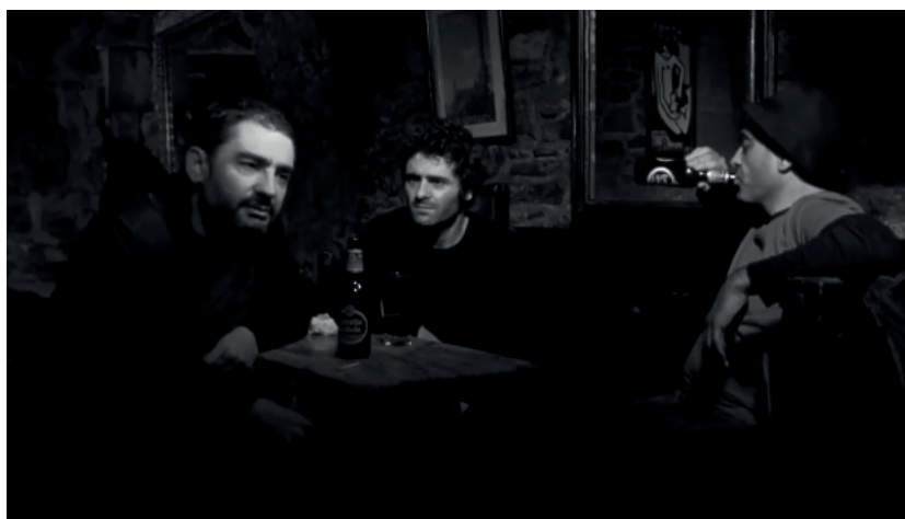
Encallados, outro máis, outro máis

logo baixar todos xuntos pola Costa Vella e a Rúa das Hortas —camiño do que semella un encontro elíptico coas traballadoras sexuais do vello Pombal— e reaparecer máis tarde bebendo cuncas e comendo polbo no Mosquito, reaberto especialmente para esta rodaxe cando o bar xa estaba definitivamente pechado (ver Zarauza en López López, 2021: 205). O itinerario destes tres personaxes seguirá polos bares da zona vella, de novo na Reixa, e despois tamén no Paraíso Perdido, onde Andy e Pato confesarán a súa incapacidade para representar a catástrofe no Prestige en proxectos anteriores: Andy, por exemplo, fala dun documental no que traballou — Muxía, política na Costa da Morte (Ricardo Llovo, 2003)— do que decidiron retirar unha escena especialmente significativa —e vergoñenta— na que aparecían uns mariñeiros empreándose nunha taberna local, cos cartos do subsidio concedido polo goberno, mentres cantaban “outro máis, outro máis”. Esta anécdota recunca unha vez máis na brétema alcohólica como refuxio e como fuxida, quer dos mariñeiros, quer dos cineastas, que non deixan de reproducir a mesma situación —embebedarse con cartos alleos— nun contexto diferente. Será que alguén consegue rexeitar esa enésima copa cando pagan outros?